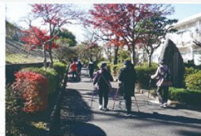
八王子市でのフレイル予防の取り組み