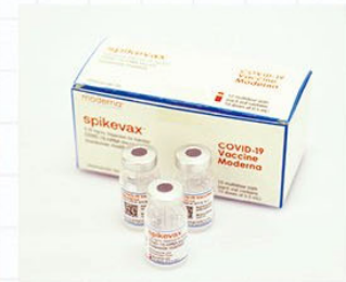
モデルナ社製ワクチン