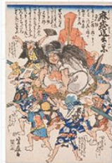
芳幾(麻疹送出しの図) 1863年 内藤記念くすり博物館所蔵