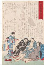
橋本直義(流行虎列刺病予防の心得) 1877年 内藤記念くすり博物館所蔵